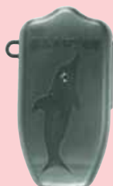
Estuche de protección